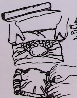
Az ételt ügyesen becsomagoljuk