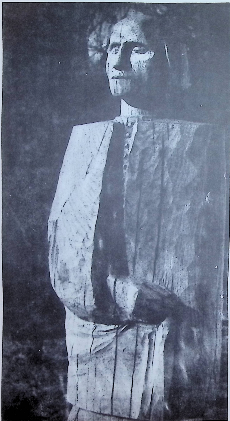
Kós András: Apáczi

tikmonyhéj = tojásbéj sóp = szekérszín, félser szívu = szíj seregélymadarak = seregélyek dészü = széles bőrv