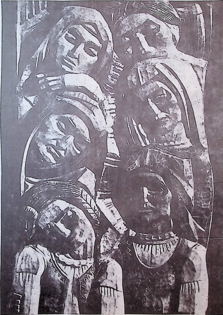
Szervátiusz Jenő: Menasági ballada (A kiváló erdélyi szobrász domborműve fából.)