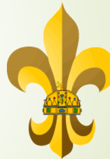
a KMCSSZ 75 éve alakult