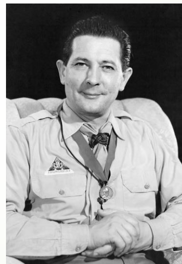
Bodnár Gábor 100 éve született