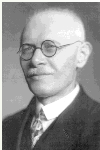
Králik László 150 éve született